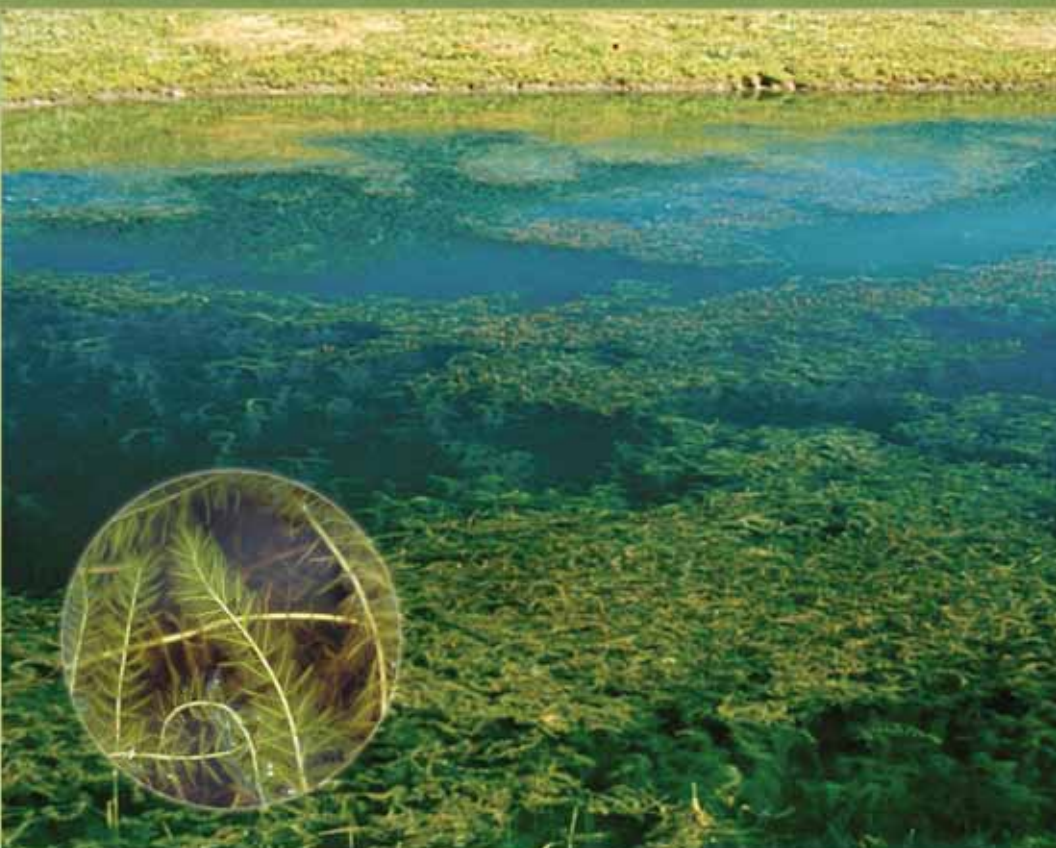
Photo: Robert L. Johnson, www.forestryimages.org Bulle: Alison Fox, www.forestryimages.org