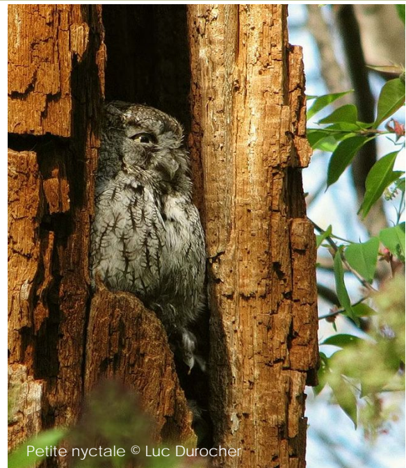
Petite nyctale

Inscription obligatoire Faites-le vite, les places sont limitées!