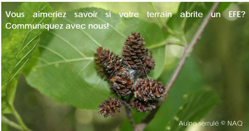
Aulne serrulé

Vous aimeriez savoir si votre terrain abrite un EFE? Communiquez avec nous!