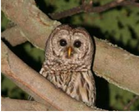
Chouette rayée au mont Yamaska

L'arrivée de l'automne vous incite à profiter de l'air frais et des couleurs magnifiques grâce à de belles promenades en forêt sur le mont Yamaska? Profitez-en pour prendre des photos et nous les faire parvenir! Et n'oubliez pas, si vous n'êtes pas propriétaire au mont Yamaska... demandez la permission ou du moins, restez sur le chemin principal!