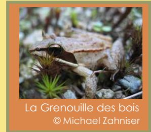
La Grenouille des bois

Suite au drainage du sol , les conditions ne sont plus propices à la survie de ces espèces. De plus, le creusage et l'entretien des fossés nécessitent de la machinerie lourde qui compacte le sol et endommage la végétation en place. Sans compter les coûts élevés de l'opération! Aucune étude n'a démontré la rentabilité du drainage dans les forêts de feuillus de la Montérégie. L'Agence forestière régionale ne finance donc plus ces travaux, estimant qu'il n'y a pas assez de preuve que les bénéfices excèdent leur coût.