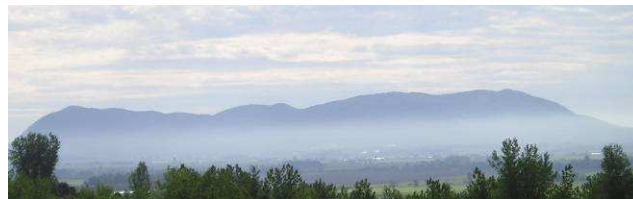
Brume estivale sur le mont Yamaska

Nous disposons de peu d'information sur les chauves-souris qui fréquentent le secteur. Ces petits mammifères méconnus sont de redoutables chasseurs d'insectes. Nous soupçonnons que le mont Yamaska, avec sa grande superficie boisée et ses lacs, est un milieu de choix pour certaines espèces peu communes comme la Chauve-souris cendrée. Au cours des prochaines semaines, nous tenterons d'en savoir plus par un inventaire nocturne. Nous utiliserons un appareil destiné à capter les cris de chauves-souris qui sont difficiles à entendre pour l'humain.