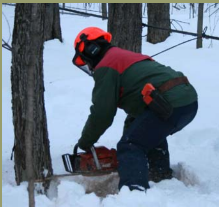
Démonstration lors de l'atelier offert en 2007 par Nature-Action Québec, sur l'abattage directionnel.

De plus, les animaux seront tout autant épargnés puisque leur période de reproduction et d'élevage des jeunes est passée et que plusieurs sont cachés, au repos pour l'hiver!