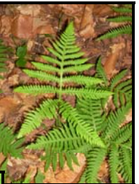
Phégoptère à hexagones