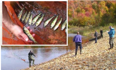
Pêche expérimentale à l'automne 2008

Pour une troisième année consécutive, plusieurs d'entre vous avez permis à notre équipe de réaliser des inventaires de plantes, reptiles, amphibiens et oiseaux sur votre propriété. Merci beaucoup! Une équipe du ministère des Ressources naturelles et de la Faune du Québec (MRNF) ainsi que deux propriétaires bénévoles