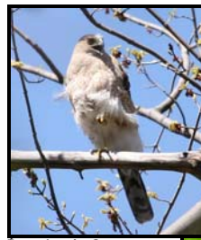
Epervier de Cooper

Toutes ces activités sont réalisées dans le cadre du Projet de protection et développement durable du mont Yamaska . Nature-Action Québec étant un organisme à but non-lucratif, ce projet est possible grâce aux contributions du gouvernement du Québec (27 000 $ du programme Volet II du MRNF), du gouvernement du Canada (programme d'intendance de l'habitat des espèces en péril) et de la Fondation de la faune du Québec.