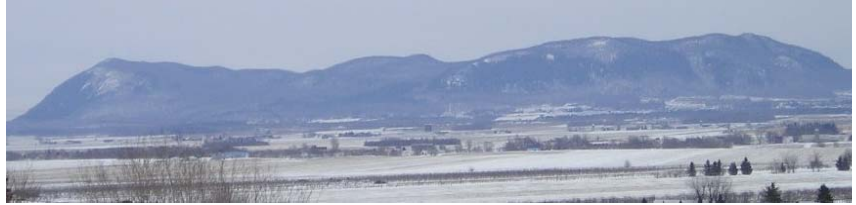
Le mont Yamaska sous la neige

Voici, en grande première, le tout nouveau bulletin express Sous mon aile! Par des publications ponctuelles et brèves, Nature-Action Québec souhaite vous informer, propriétaires au mont Yamaska et responsables des municipalités de Saint-Pie et Saint-Paul d'Abbotsford, des activités que nous réalisons sur la montagne. Également au rendez-vous, de l'information en lien avec nos projets à venir, des anecdotes, des suggestions.